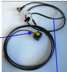
3. Cable de alimentación Power supply cable