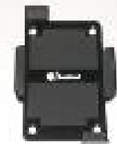
4. Soporte Bracket