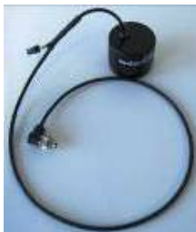
1. Buzzer Buzzer